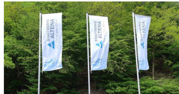
Optimierte Logistikwege: die neue Lagerhalle an der Westiger Straße.