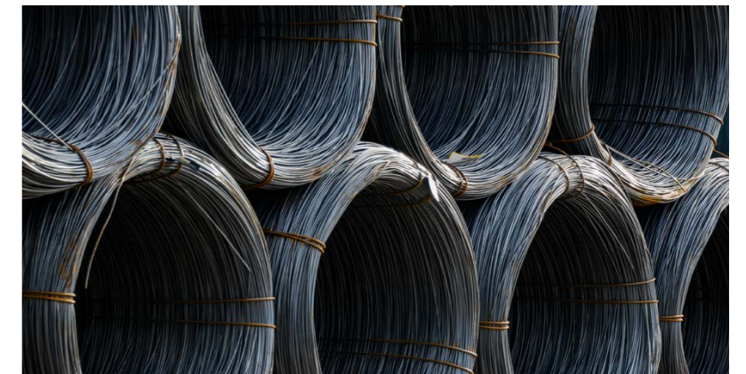
Wichtiger Wirtschaftsfaktor für Altena: die Drahtindustrie.

Wenn Sie aufgrund der Corona-Krise unverschuldet in Not geraten sind, sprechen Sie uns bitte an. Wir werden gemeinsam eine Lösung finden. Sie erreichen uns nach wie vor telefonisch und per E-Mail.